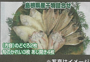
鳥根黒産子物詰合せ (内容)のどろろ2枚 旬のかれい3枚 あじ開き4枚