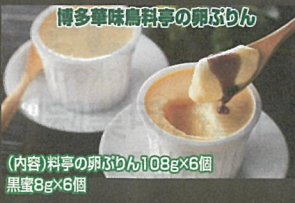
博多華味高料亭の卵ぶりん (内容)料亭の卵ぶりん108g×6個 黒蜜8g×6個