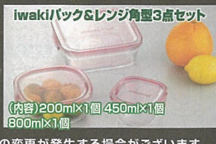
iwakiバック&レンジ角型3点セット (内容)200ml×1個 450ml×1個 800ml×1個

※写真はイメージです。※メーカーの都合により商品内容の変更が発生する場合がございます。