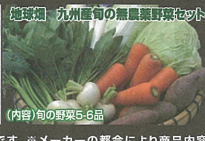
地球畑 九州産旬の無農薬野菜セット (内容)旬の野菜5-6品