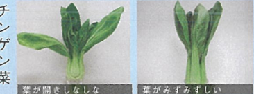
チンゲン菜 葉が開きしなしな 葉がみずみずしい

■7日間保存した場合の比較(パナソニック(株)実験)※7 Wシャキシャキ野菜室非搭載機種 2013年機種 NR-F618XG Wシャキシャキ野菜室搭載機種 2021年機種 NR-F607WPX