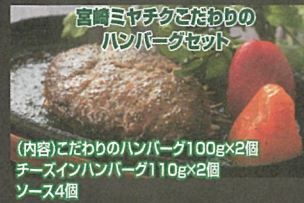
宮崎ミヤチクをたのむのハンバーグセット (内容)こだわりのハンバーグ100g×2個 チーズインハンバーグ110g×2個 ソース4個